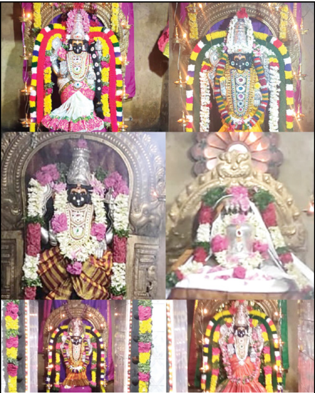
"Navarathiri" At Poovanur's Kailasanathar Kalyani Amman Temple

Email: frontoffice_kotturpuram@apollohospitals.com